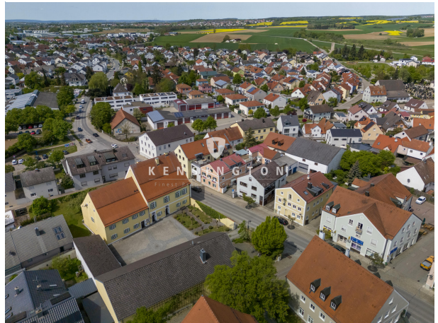
Mitten im schönen Kösching!