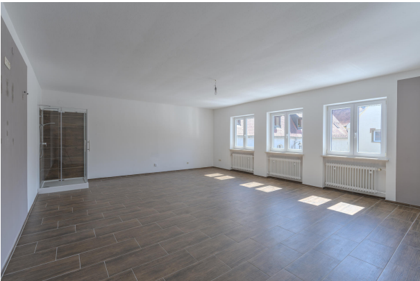
1. OG EZ Wohnung