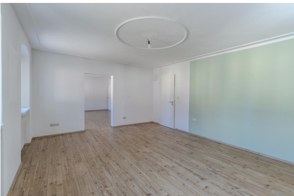
1. OG Wohnbereich