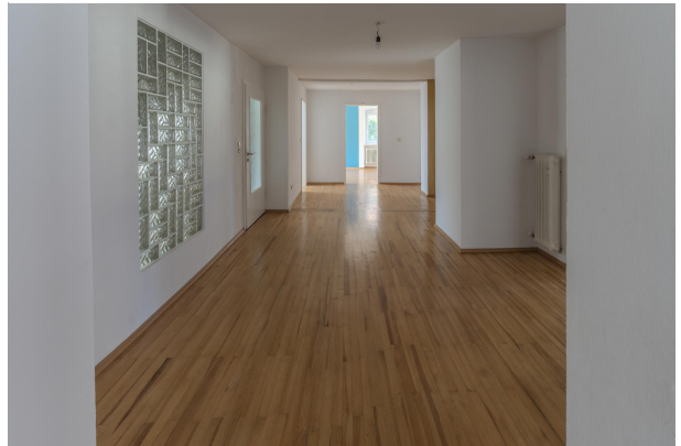
1. OG Wohnung Flur