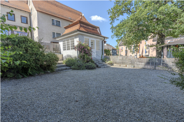
Steingarten / Freisitz