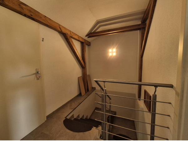
Raum für ein mögliches WC im DG