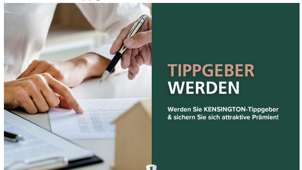
Werden Sie Tippgeber!

KENSINGTON FINEST PROPERTIES INTERNATIONAL