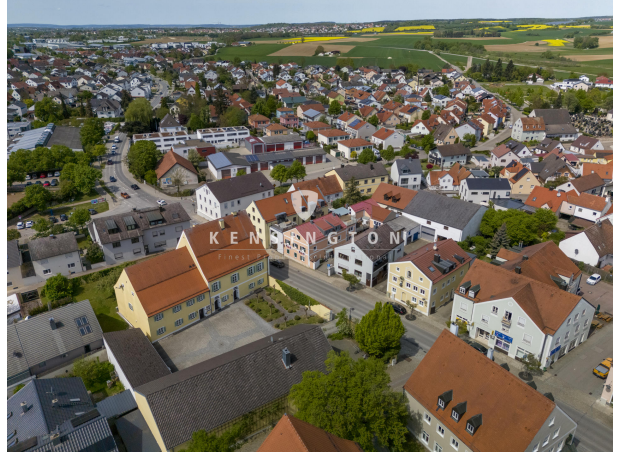
Mitten im schönen Kösching!